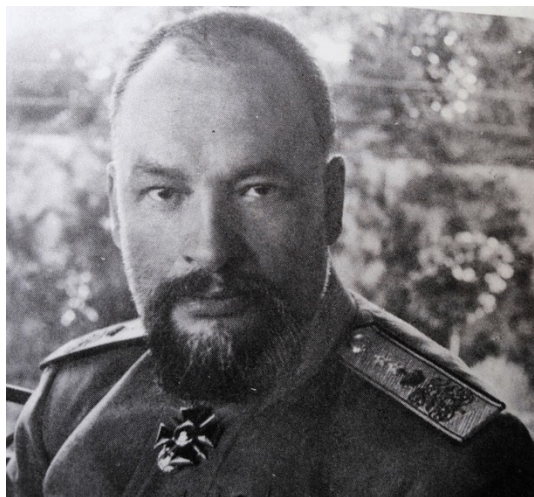
Евгений Сергеевич Боткин

Евгений Сергеевич призывал своих студентов: «Пойдемте все с любовью к больному человеку, чтобы вместе учиться, как быть ему полезным [1, с. 6]. Ему был дорог каждый пациент, он считал долгом врача служение больному [1, с. 4] и учил этому своих студентов. «Больница — дом для больных», и «они имеют право на уход и лечение, право на покой и на распоряжение самими собой в пределах дозволенного сообразно с болезнью.» «Больные должны быть уверены, — поучал доктор Боткин своих студентов, — что вы не отнесетесь без внимания ни к одной из мельчайших жалоб их. [1, с. 81] «...добросовестный врач и не может не выслушать больного, который как к духовнику принес к нему все стоны своей души» [1, с. 91].