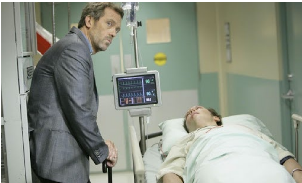
Кадр из сериала «Доктор Хаус»

«сволочь», как открыто и неоднократно называют его прямо в глаза его коллеги, и сам Хаус не отрицает этого, но ему безразлично, что о нем думают другие, главное — что он сам думает о себе. Он не интересуется своими пациентами, не общается с ними, крайне редко заходит к ним в палату, его интересует лишь «загадка», «случай», а не человек. Это врач нового поколения, отрицающий все гуманистические, альтруистические принципы традиционной медицины, главным из которых, начиная с Гиппократа, был принцип «не навреди». Он готов спровоцировать тяжелое осложнение, резко обострить течение болезни, практически подвергая пациента пытке. Но «цель оправдывает средства!» И, чаще всего, он — победитель, по крайней мере, по версии авторов сериала.